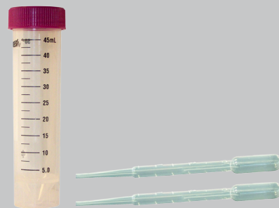
Kit TRACANT CARBURANT