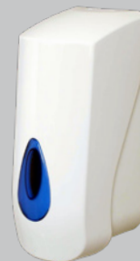
Capacité 900 ml Réf. DSLM/A