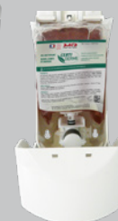
Distributeur de savon liquide pour recharges souples de 800 ml Réf. DSLRS800/A

DACD ne peut avoir connaissance de toutes les applications dans lesquelles sont utilisés ses produits et des conditions de leur emploi. DACD n'assume aucune responsabilité quant à la convenance de ses produits pour une utilisation donnée ou dans un but particulier. Les informations ne doivent en aucun cas se substituer aux essais préliminaires qu'il est indispensable d'effectuer pour vérifier l'adéquation du produit à chaque cas déterminé.