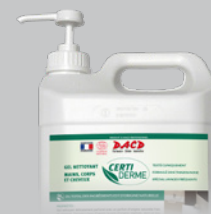
Bidon de 5 Litres avec pompe intégrée

L'hygiène des mains est un maillon essentiel dans la chaîne qualité et le port des gants ne dispense pas le personnel du lavage des mains. Éviter le contact avec les yeux. En cas de projection oculaire, rincer abondamment avec de l'eau. Stockage à une température comprise entre 5°C et 30°C. Conservation : 2 ans dans son emballage d'origine non ouvert, 12 mois après ouverture de l'emballage.