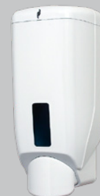
Capacité 1,2 Litre Réf. DSL1200/A