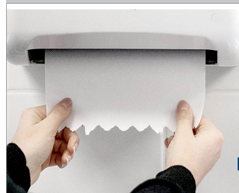
Distribution contrôlée d'essuie-mains

Perforation tous les 235 mm : la plus adaptée du marché