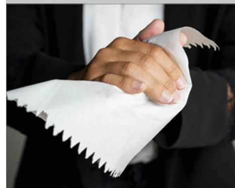
Essuyage papier ultra résistant