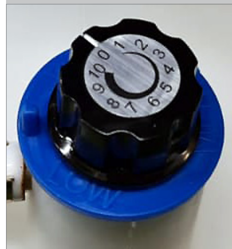
Valve pour régulation du débit de 0 à 100%