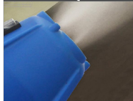
Pulvérisation jusqu'à 15 mètres