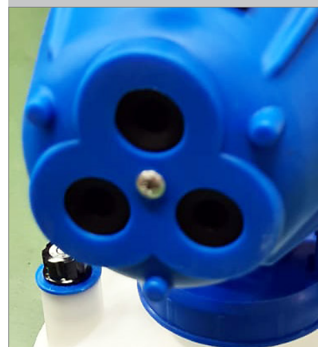
3 têtes de nébulisation