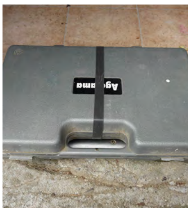
Maintenir fermée une mallette ne fermant plus