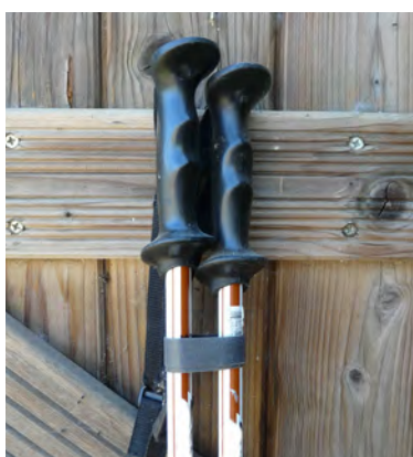
Attacher des bâtons de ski ou de randonnée