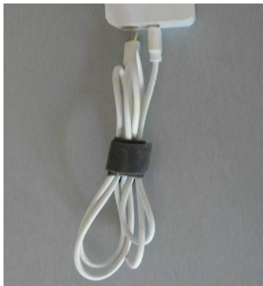
Attacher tous types de cables