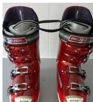
Attacher les chaussures de ski pour les porter plus facilement