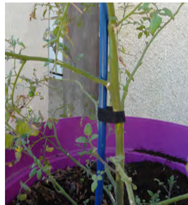
Attacher une plante à son tuteur