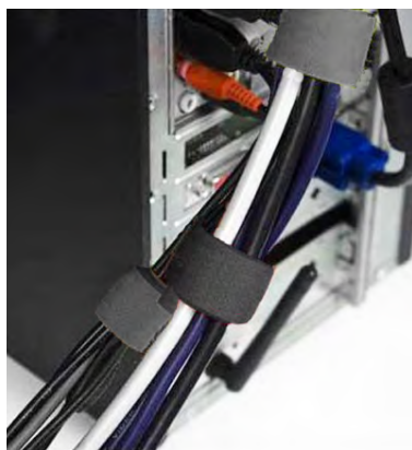
Ordonner les câbles d'un pc