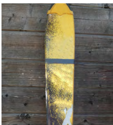
Attacher des skis