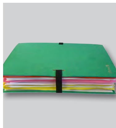
Remplacer la sangle d'un dossier

DACD ne peut avoir connaissance de toutes les applications dans lesquelles sont utilisés ses produits et des conditions de leur emploi. DACD n'assume aucune responsabilité quant à la convenance de ses produits pour une utilisation donnée ou dans un but particulier. Les informations ne doivent en aucun cas se substituer aux essais préliminaires qu'il est indispensable d'effectuer pour vérifier l'adéquation du produit à chaque cas déterminé.