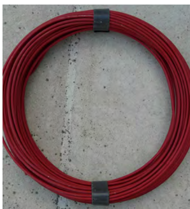
Attacher des fils électriques