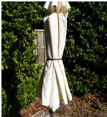
Maintenir un parasol fermé