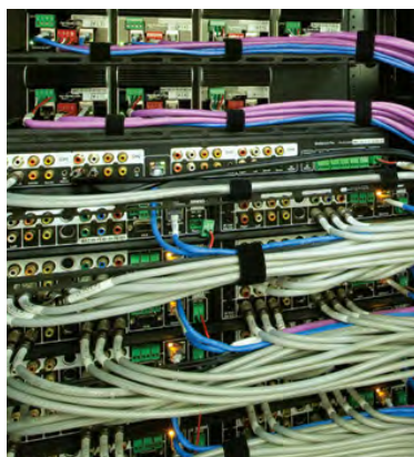
Attacher les câbles dans les baies informatiques